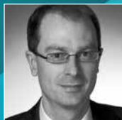
Ernst Stahl Universität Regens- burg GmbH